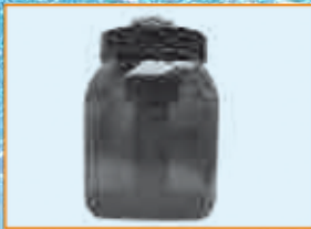
Järjestelmä ennen käsittelyä