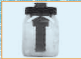
Järjestelmä käsittelyn jälkeen